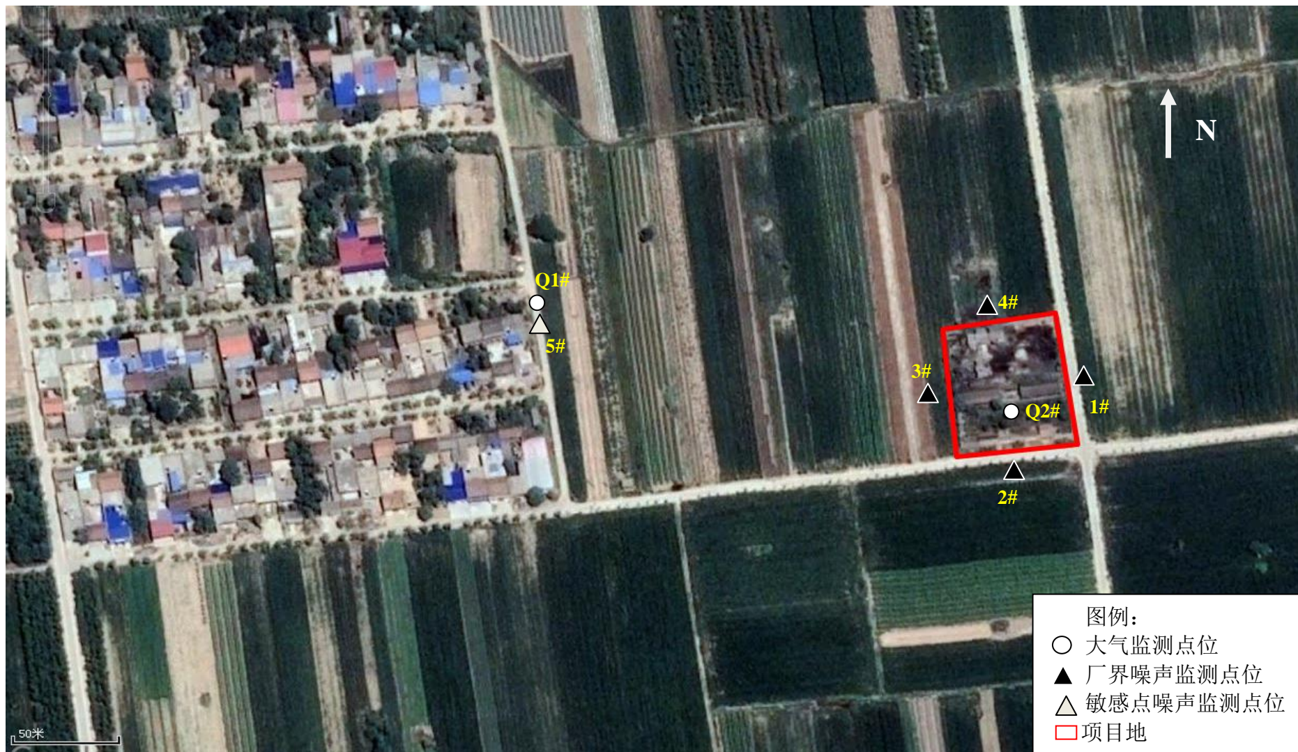
附图一 大气、噪声监测点位示意图