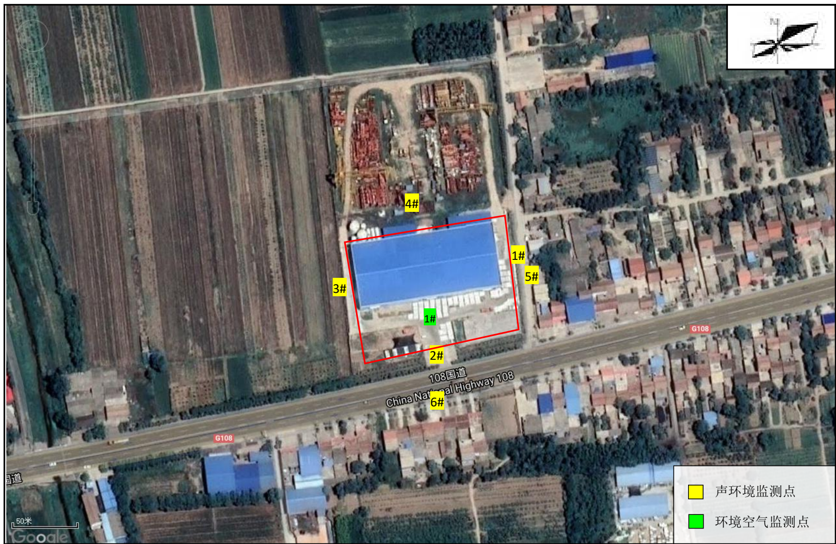
附图 5 环境质量现状监测点位图