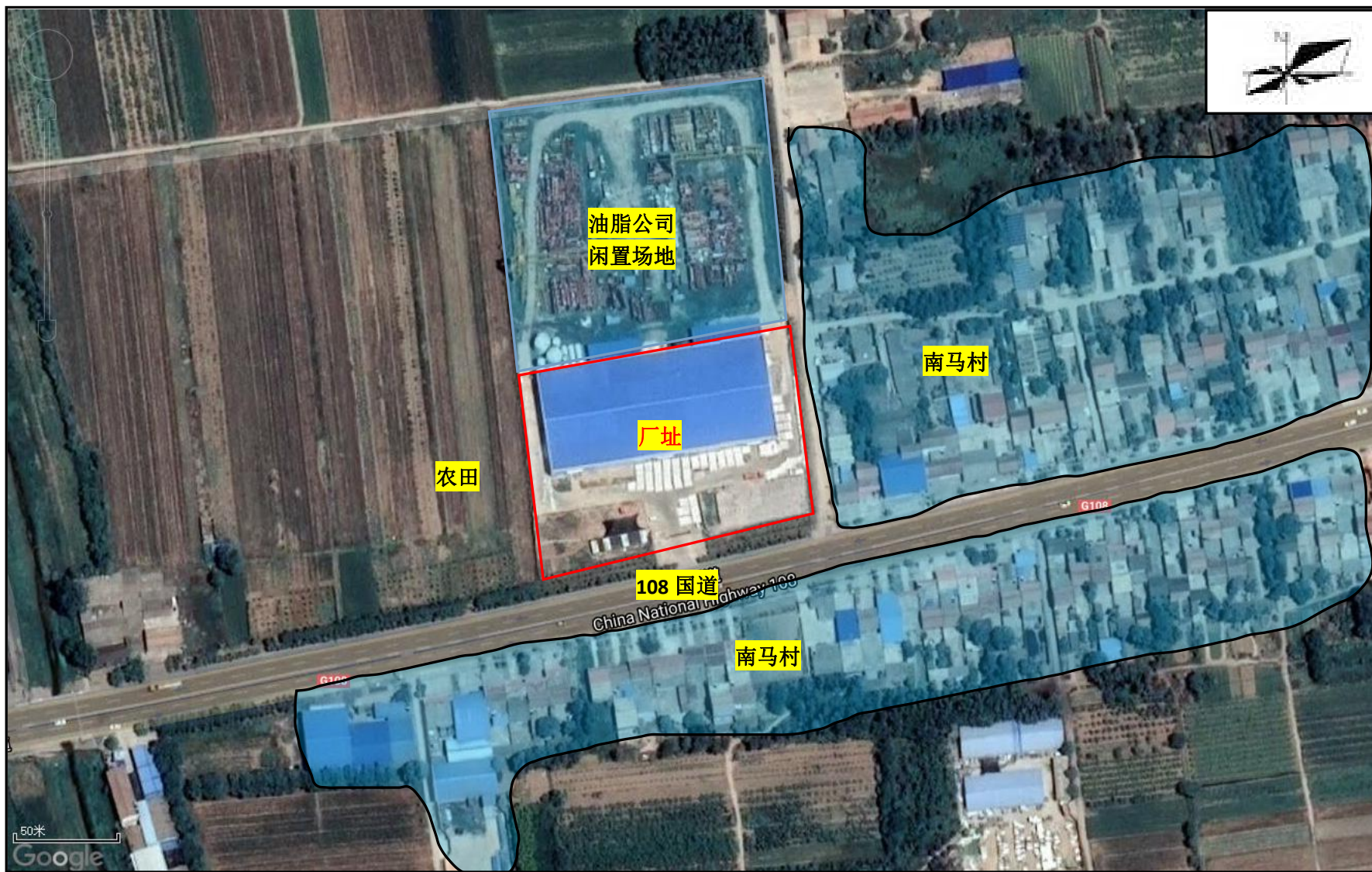
附图 2 四至关系图