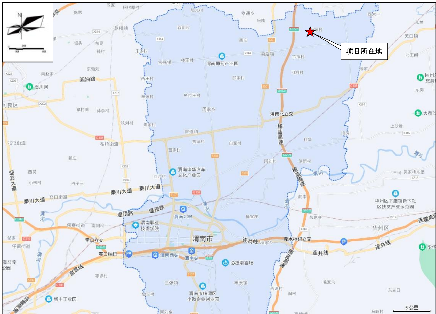
附图一 项目地理位置图