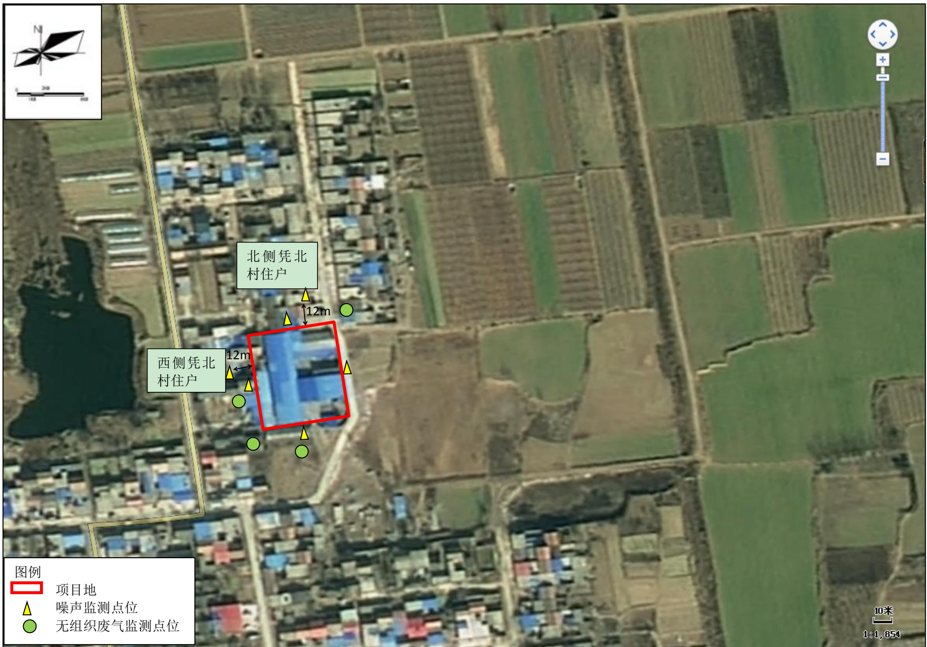
附图二 项目四邻关系及监测布点图布点图