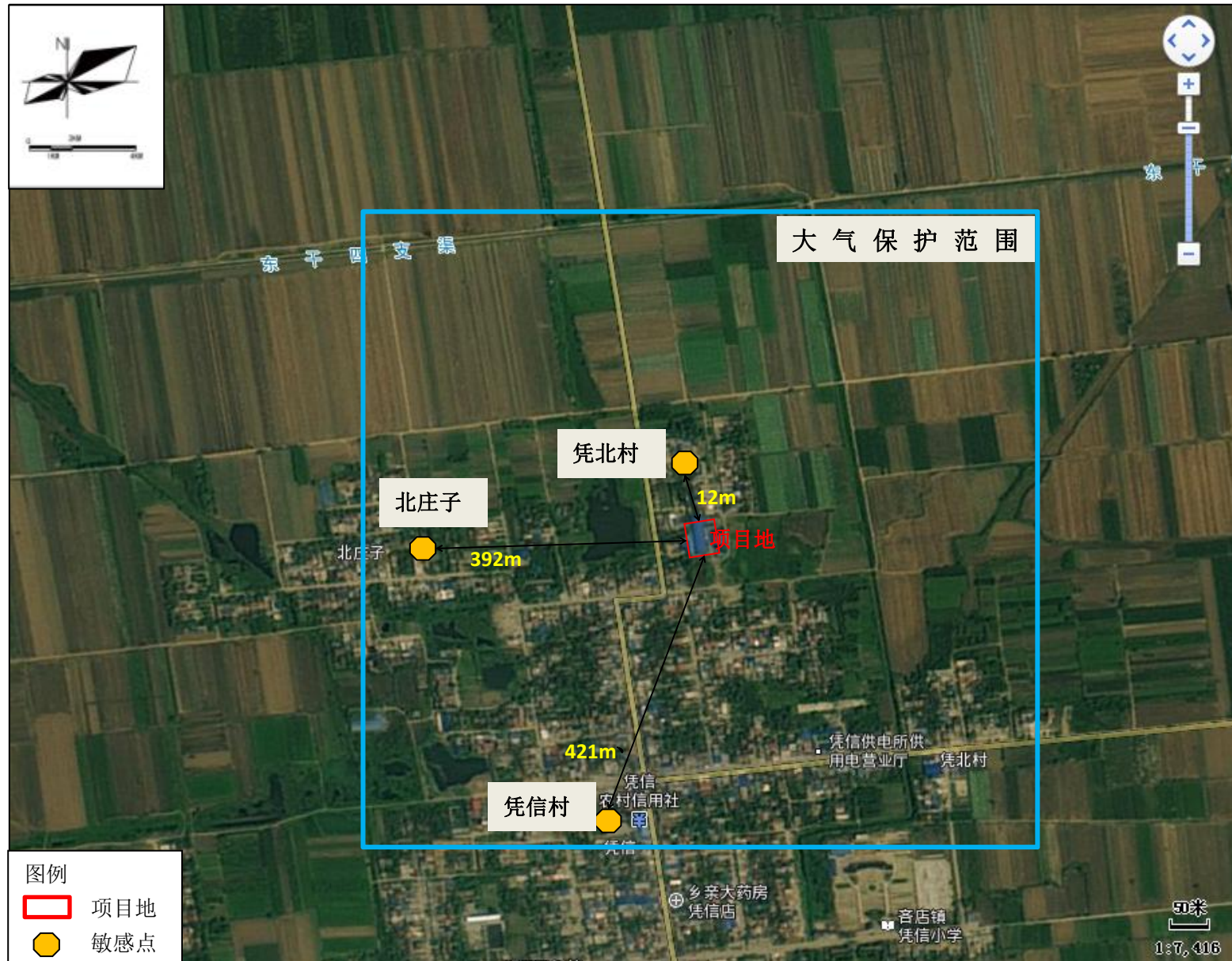
附图三 项目大气评价范围及保护目标分布图