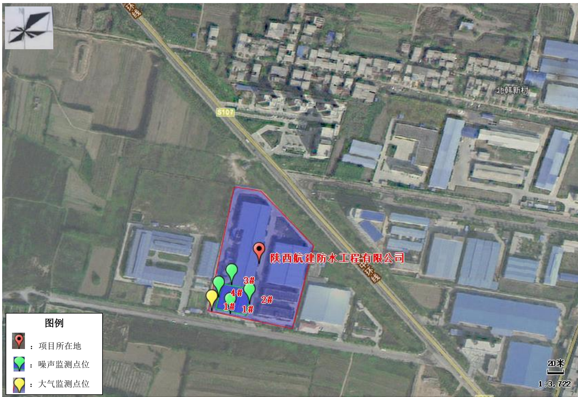
附图 5 项目大气、噪声现状监测点位图