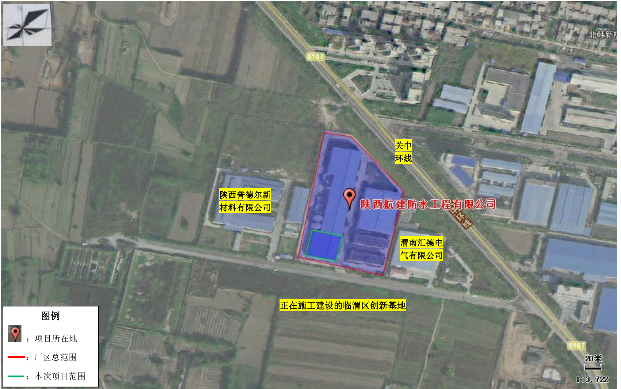
附图 2 项目四邻关系图